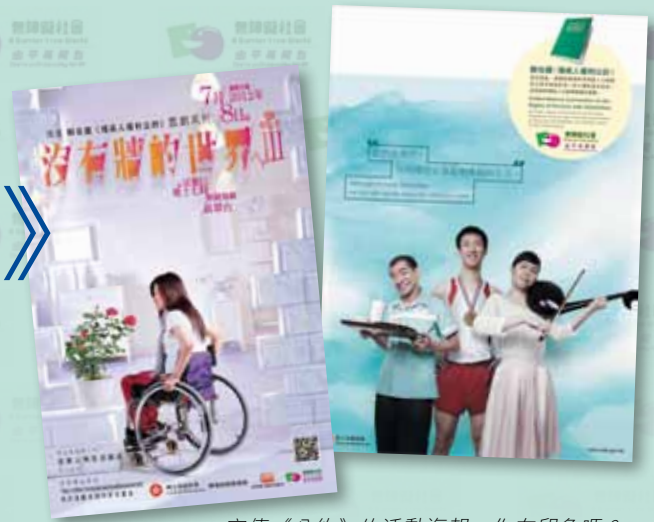
宣傳《公約》的活動海報，你有印象嗎？

早在1948年聯合國大會通過《世界人權宣言》，確認包括殘疾人士在內的所有人，天生擁有不可剝奪的權利，可是殘疾人士仍普遍受到歧視。與此同時，保障婦女和兒童權利相關的公約已陸續推行。故此，過去超過四分之一世紀，在不少為殘疾人士發聲的機構積極推動下，經過五年多的起草與協議，《公約》於2006年12月終於正式通過，這是促進、維護和確保全球6億5千萬殘疾人士，享有與普通人平等權利、自由及尊嚴的重要里程碑。