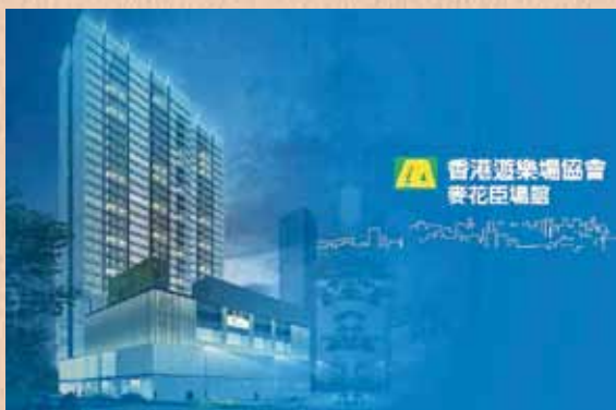
位於旺角的麥花臣場館預計於今年三月重開，新落成的場館將配備完善的無障礙設施。