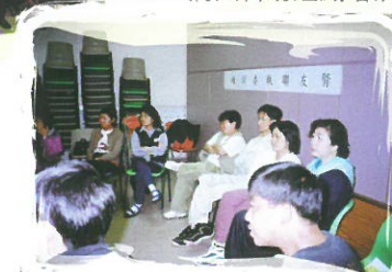
病人自助組織培訓