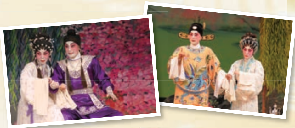
◀ 今年慈善粵劇的劇目為《無情寶劍有情天》，為腦科疾病包括柏金遜症、認知障礙症、中風和腦癱等患者的復康服務籌募經費，藉活動教育大眾認識有關疾病和鼓勵患者多參與社交活動，積極融入社區生活。